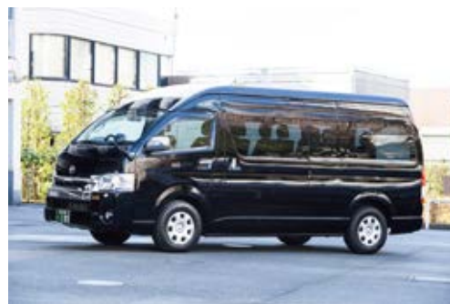
TOYOTA グランドキャビン